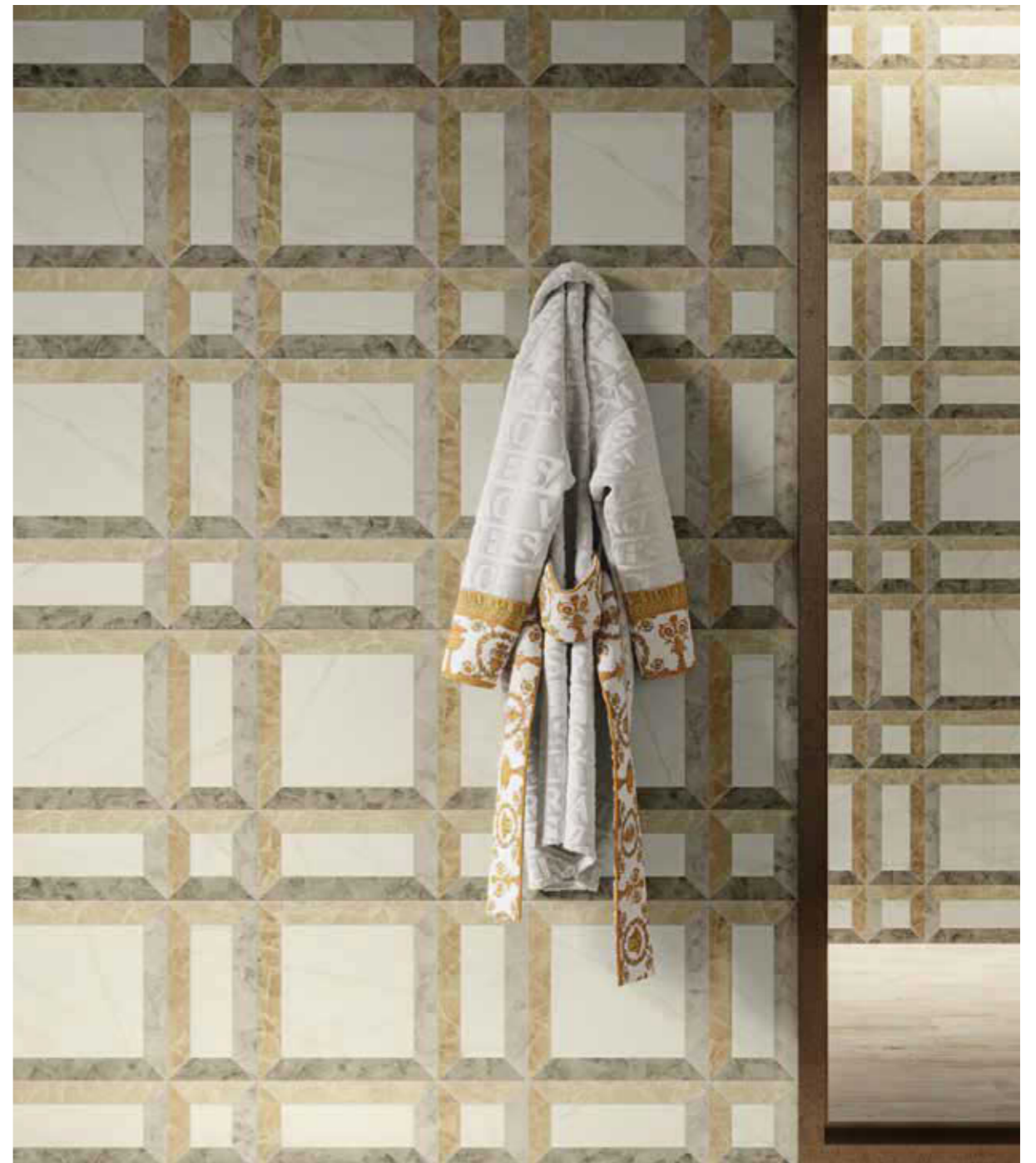
Wall Frame Avorio Lux 3D 60x120